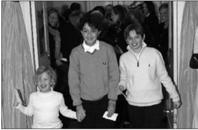
C'è chi va a Imparolopera, chi invece preferisce l'originale