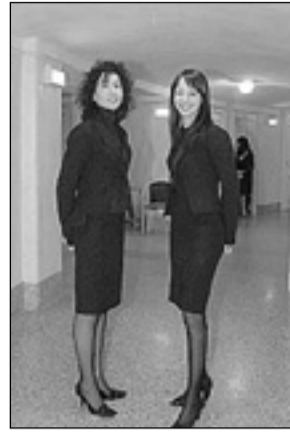
Le maschere Laura e Viola