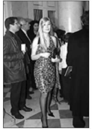
Pailletes da "prima"

LIRICA Al Regio ieri il debutto dell'opera